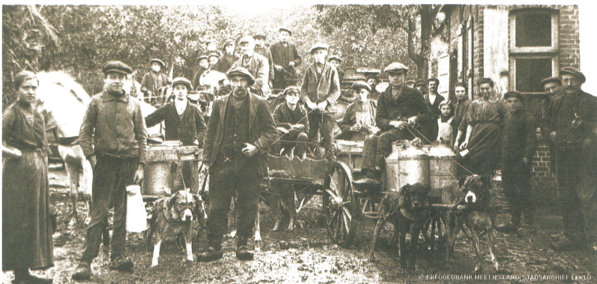
In landelijke regio's zoals het Meetjesland was de melkvoorraad voldoende tot diep in de oorlog. Met hondenkarren werd in 1917 de melk rondgevoerd.

INFORMATIE – Marc Van Meirvenne, Universiteit Gent, marc.vanmeirvenne@ugent.be of www.wo1.ugent.be