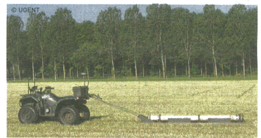
De Universiteit Gent wil bodemsensoren inzetten om in de bodem te zoeken naar restanten van WO I.

CAG en het departement Landbouw en Visserij organiseren vanaf dit jaar diverse publieksactiviteiten rond de herdenking van de Eerste Wereldoorlog. Samen met enkele spelers uit de erfgoed- en landbouwsector werd een samenwerkingsverband rond landbouw, visserij en voeding tijdens de Eerste Wereldoorlog opgericht, onder de gelijknamige noemer 'Boter bij de vis'. Gelijktijdig met de uitgave van het boek werd de projectwebsite www.boterbijdeviswo1.be gelanceerd. Die bevat verhalen en beeldmateriaal over het thema, en toont de activiteiten van de partners in het samenwerkingsverband. Vanaf het voorjaar van 2015 organiseert het CAG samen met deze partners een rondreizende tentoonstelling over het onderwerp.